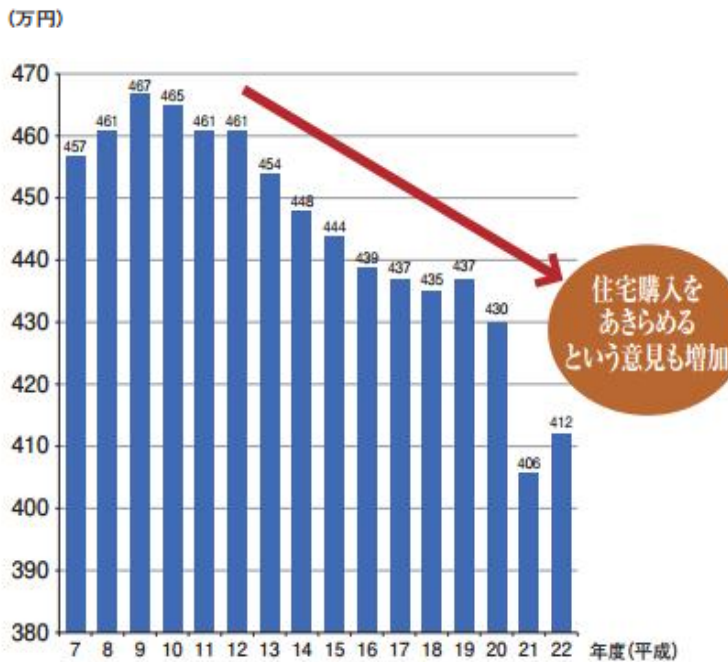
サラリーマン平均年収の推移